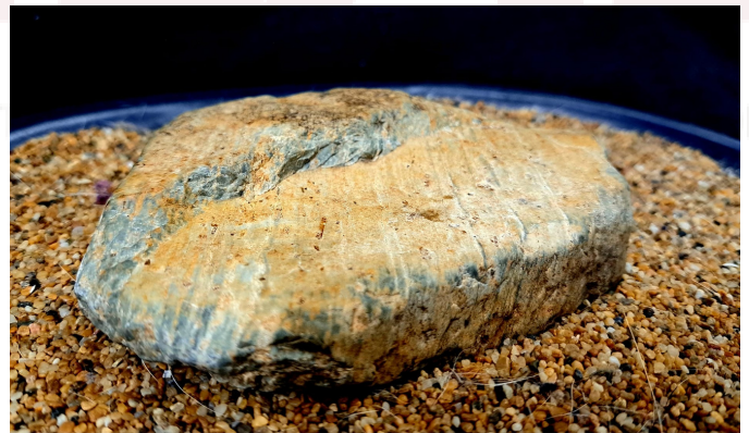
Dan seki. Roca paisaje en forma de terrazas. Se trata de una roca con bajo grado de metamorfosis regional llamada eclogita. Con un color dorado suave en superficie y verde de fondo. 12 cms de frente x 3 cms. de altura