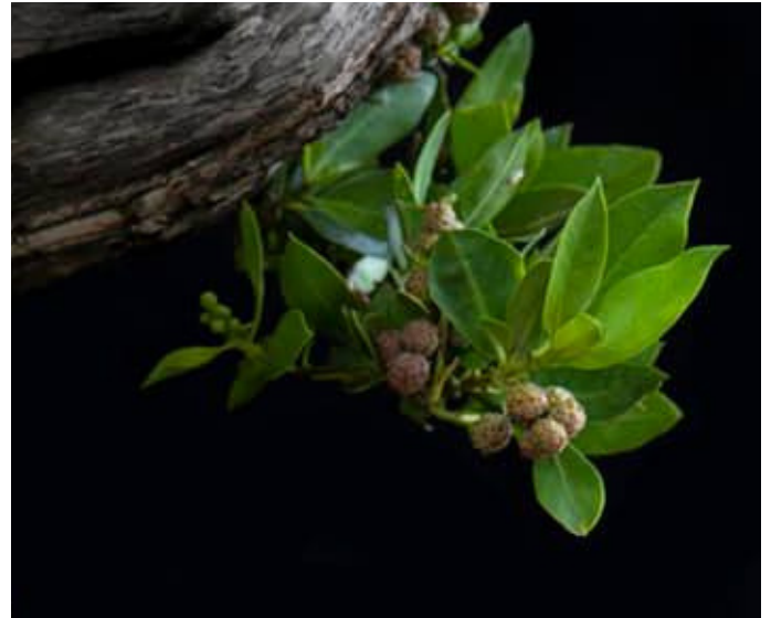
Hojas y semillas