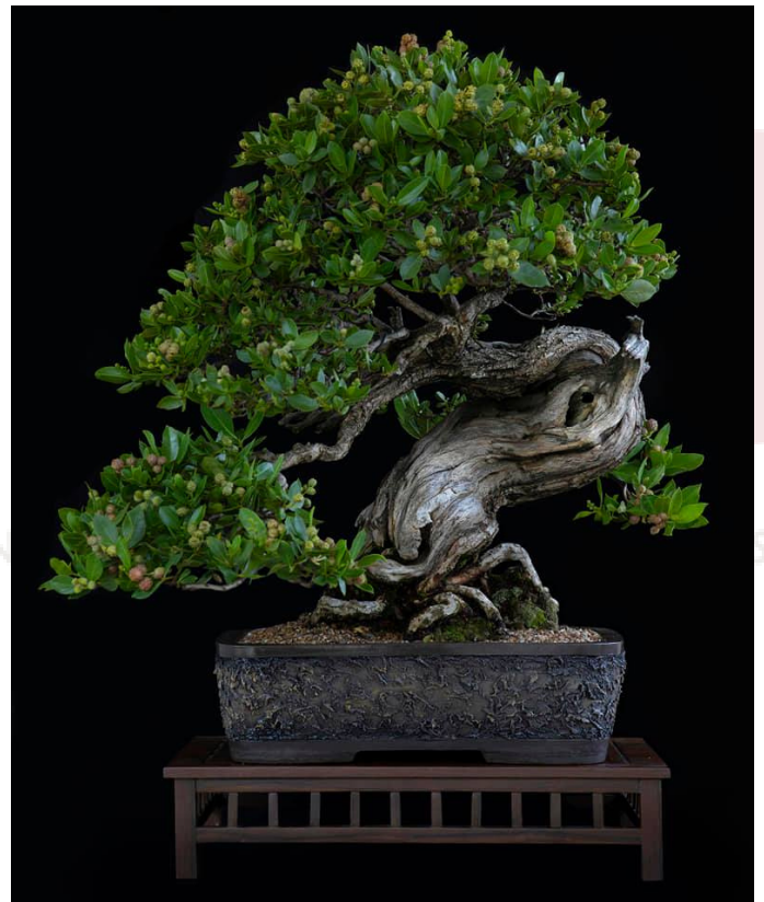
Mangle Botón Artista: Nacho Marin