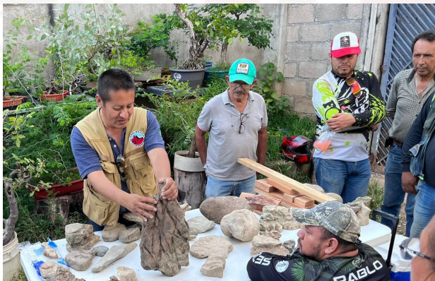
Elementos a tener en cuenta en recolección

Como cualquier otro arte, el arte del suiseki posee una característica constante y esa característica es su practica, es compartir con otros dudas o porque no? ir a coleccionar rocas que podamos usar para po.co a poco crear nuestras propias colecciones.